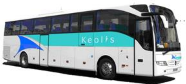
Transports KEOLIS = 385,00 €