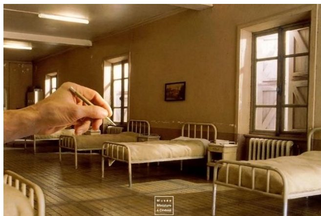
Voyage de fin d'année Musée des miniatures = 120,50 €