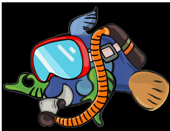
Voyage de fin d'année Aquarium de LYON = 221,00 €